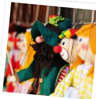
#puppentheater #rabesocke #pettersauudfiadus

Auch musikalisch wird in der Arena einiges geboten. Erlebt die schaurig schönen Klänge zu Walpurgis oder genießt das Filmmusik-Konzert des Nordharzer Städtebundtheaters mit Solisten und Harzer Sinfonikern.